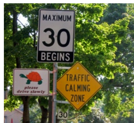
Un message à faire passer...

L'étude Prognos rappelle par ailleurs que la sécurité ne se réduit pas à l'absence d'accidents, mais comprend aussi la réduction des «conflits» entre usagers et l'amélioration