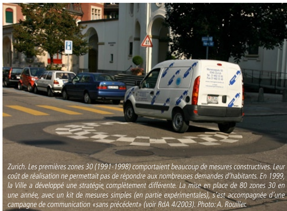
Zurich. Les premières zones 30 (1991-1998) comportaient beaucoup de mesures constructives. Leur coût de réalisation ne permettait pas de répondre aux nombreuses demandes d'habitants. En 1999, la Ville a développé une stratégie complètement différente. La mise en place de 80 zones 30 en une année, avec un kit de mesures simples (en partie expérimentales), s'est accompagnée d'une campagne de communication «sans précédent» (voir RdA 4/2003).

Les évaluations des exemples recensés s'étant concentrées sur la question des aménagements, on ne sait par contre rien des processus qui ont précédé l'instauration des zones 30, du type de communication qui a accompagné leur mise en œuvre, de possibles campagnes de contrôle et de leurs effets, etc. On peut faire l'hypothèse que l'introduction des zones 30 à large échelle en Allemagne, par